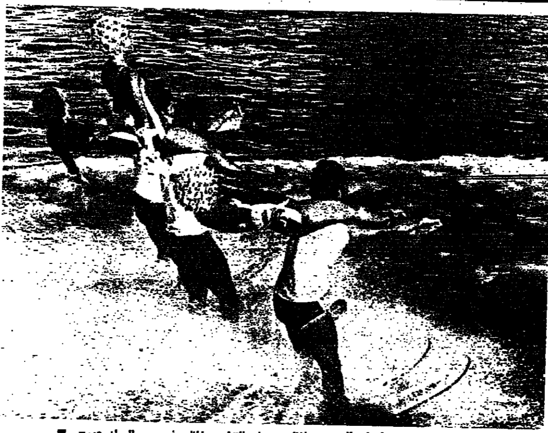
لقطة من الاستعراضات التي جرت خلال مهرجان التزلج المائي في مسبح السان جورج